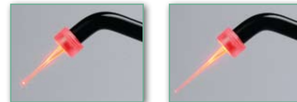
Embouts jetable Aseptim Plus conçus pour le traitement des poches parodontales et en endodontie.